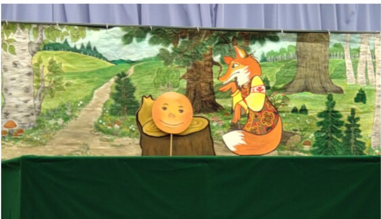
ロシア語人形劇「お団子パン」の1場面