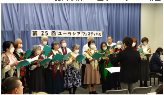
合唱団「ミール」の歌唱