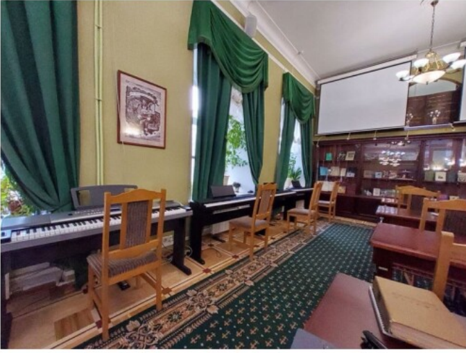
ゴーゴリの家博物館(Дом Н. В. Гоголя) 2階閲覧室の様子。左手にピアノが見える