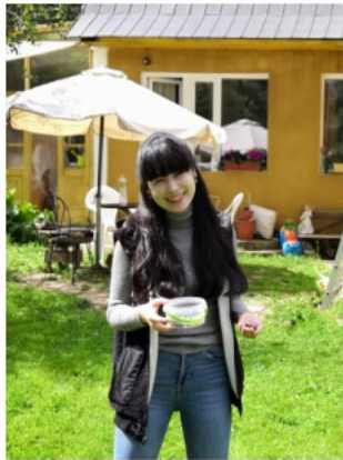
【写真】ブルーベリーの収穫の手伝いをする筆者

多民族が共生するロシア人が多い。また、我々日入したクワラルチーラ(ア)では、日常生活の中で実に本人によく似た顔立ちであ(パート)には任んではない。さまざまなルーツを持つ人に出会う。筆者がモスクワに留学して間もない頃、在留学生生活を通して生活をする本宅とい籍する音楽院の寮あるいは、街中で、「トウイ、カザシカ?」(君、カザフ人?)と聞かれたことが何度かあった。カザシカとは、ロシア語でカザフ人女性のことだ。それまでカザフという民族の名前は知識として彼らを見たことはなかった。ユダヤ人とカザフ人を両似ていると言われたこと初めて意識し見渡してみた。モスクワ音楽院の各専攻にはカザフ人学生が一定数いることを知った。しかし、音楽家として非常に優秀して国内外で活動している。スウェーデンで学んだのち、1993年と、モスクワ音楽院の専攻攻にはカザフ人学生が一定数いることを知った。しかし、音楽家として非常に優秀して国内外で活動している。