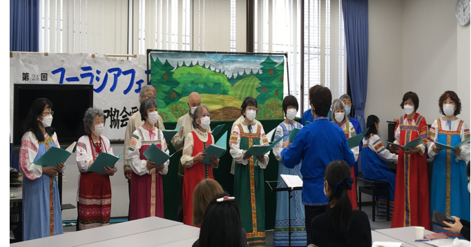
合唱団「ミール」によるロシア民謡合唱

12月5日（日）11時、ユーラシアバザールの開店ととも、2年半ぶりのユーラシアフェスティバルが幕を開けました。黒パン、シンドレラを始めマトリョーシカやプラトックなどのロシア民芸品、ジョージアワイン、ボルシチの素、アリオンカクッキーなどのユーラシア物産は予想外の売れ行きで、午前中には品切れとなるものも出てきました。