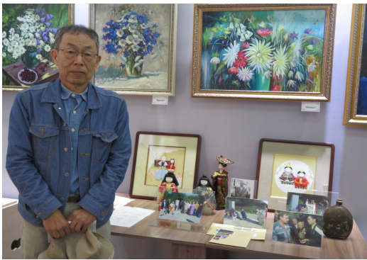
【写真】スヴァボードヌイの博物館にて

ワールド・コラボ・フェスタは 持続可能な社会の実現のため、中 部地域の国際交流・国際協力・多 文化共生の活動の輪を広げ、市民 NGO、NPO、企業、行政が協 力して「学び、考え、行動する場」 を作り上げるイベントです。 日本ユーラシア協会愛知県連は 10月13日(日) 11時30分からウェー ラ・ダンス・スクールの子どもた ちと合唱団「ミール」が参加し、 ミールは「ウラルのぐみの木」 「前線にも春が来た(鶯)」、「バ イカル湖のほとり」、「ポーリュシユ カ・ポーレ」の4曲を歌います。 日本ウクライナ協会は同じ13日 (日)の12時30分から歌と踊りの ウクライナショーを行います。 また日本ウクライナ文化協会 (10月13日・日曜日)や「チエ ノブイリ救援中部」(10月12日・ 土曜日)のブースもありますので、 是非お誘いあわせの上、お出かけ ください。