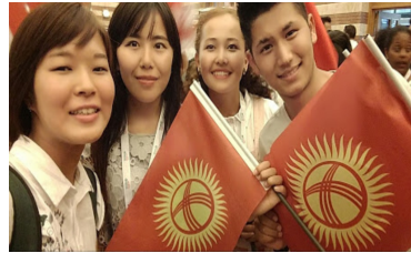
【写真】キルギス人との出会い

ある日、サマースクール全体のイベントで、皆で振るようにとトルコと自分の国の国旗を一つずつ配布された。私は先程見かけた彼を見つけた。その人は、やっぱ日本人のような顔立ちをし