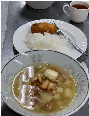
【写真】出来上がった料理

6月9日(土) 東生涯教育センターの料理室で料理講師はジトール出身のウバ、バターとデイルを包んでフライにしたのが「キエフ風カツレツ」です。衣を二度付けし、サラダオイル「おいしい」という意味のウクライナ美人で日でも高温のオーブンで焼きました。