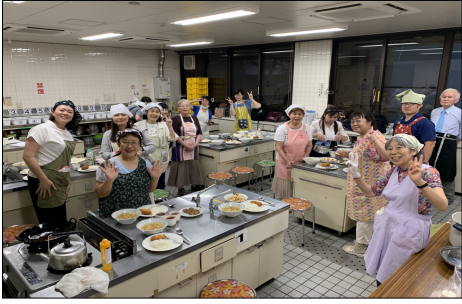
【写真】参加者のみなさん

メールアドレス eurasia_aichi@yahoo.co.jp ホームページ http://nichiyu2015.webcrow.jp