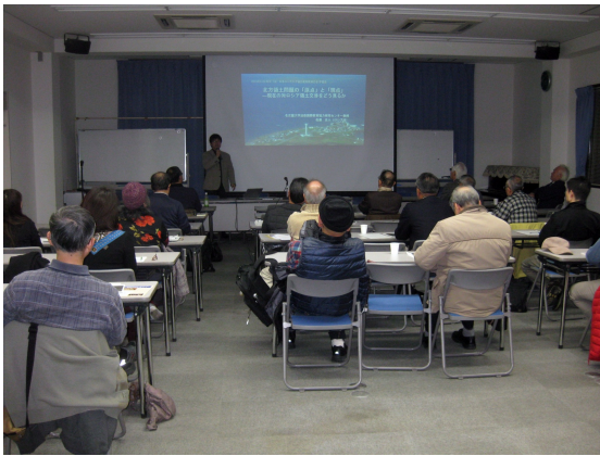
【写真】学習会のようす

11月30日（土）17時30分 講演していただきました。以下は講演の概要です。から愛知民主会館2階会議室において「日露平和条約と領土問題学習会」が行われ、1855年の日露通商条約で国後、択捉、歯舞、色丹は日本の領土、その北側はロシア領と決められ、樺太とソ連との間に平和条約が結ばれた後に歯舞、色丹島を引き渡すことが確認された。日露両国民が混在するとい渡すことが確認された。しかし、それによって行われう状態だった。しかし、それは都合が悪いということ返還を決定していたが、学習会は日米安保条約が1875年に樺太千島交換条約が結ばれ千島列島は長官に「サンフランシスコ平和条約で放棄し、千島列島」に国後・法政国際協力研究センターになった。そして日露戦争後 択捉は含まれていない。