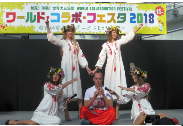
【写真】ウクライナファッションショー