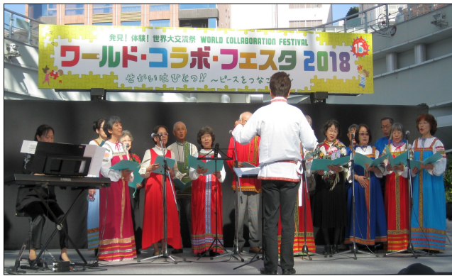
【写真】合唱団「ミール」

11月10日・11日、持続可能な社会の実現のため、中・共生の活動を広げ、市民、NGO・NPO、企業、行政が協力して「学び、考え、行動する場」をつくりあげ、15回目のワールド・コラボ・フェスタが開催された。「世界大交流」のお祭りイベントとして、国際交流・国際協力団体が大集合し、日ごろの活動を楽しく紹介、呼びかけ、宣伝した。また、企画内容を検討し、国際交流・文化を広げる場として、参加していききたい。 （安原勝彦）