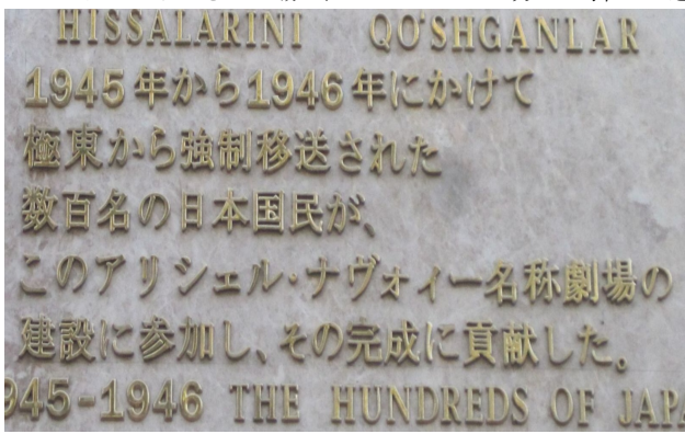
【写真】 ナヴォイ劇場の日本人を讃えるプレート

ウズベキスタンの首都であるタシケントの中心部に、ナヴォイ劇場というのがあります。この劇場は第二次世界大戦でソ連の捕虜となり、タシケントに抑留されていた旧日本兵の強制労働によって建てられて、1966年のタシケント大地震でもびくとせず、市民たちの避難場所としても使われたという。そのためなのか日本人はウズベキスタンの人から尊敬を受け、この劇場の側面の