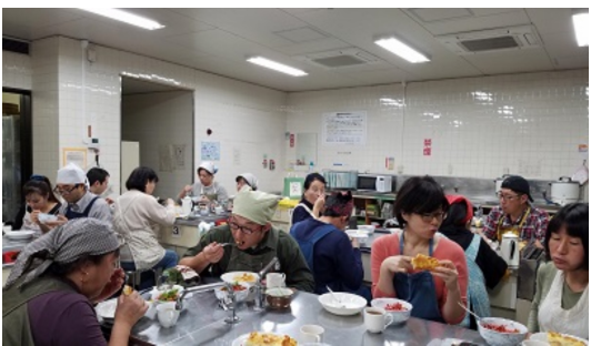
【写真】楽しい試食タイム

第18回へチカ報告 魚のパイとヴィネグレットに満足！ 大きさをそろえて小さな角型に切り、さらに詰詰のグリーンピースも加えて塩コショウ、サラダオイル、ピクルスの漬け汁少々で味をつけ、たものが「ヴィネグレット」。