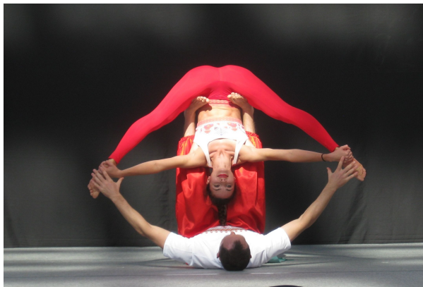
【写真】ウクライナヨガのパフォーマンス