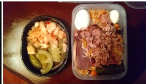
プロフトとサラダ（約700円）

翌22日（水）は街を散策しました。穏やかな晴天で、屋には公園の出店でハンバーガー（＋コーラ350mlで約600円）を食べ、ナウォイ劇場（旧日本軍兵士が建設に携わった）、ティムール博物館、そして市内に3軒