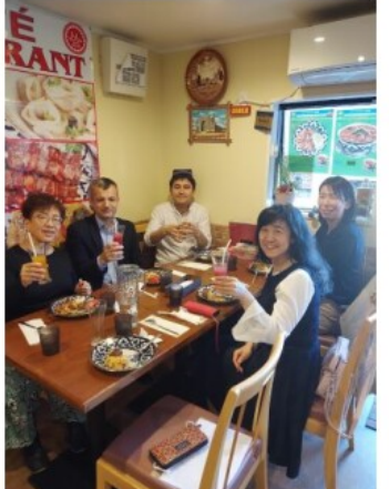
ウズベキスタン料理のレストラン「タバスム」でランチ会が開かれました。

愛知県連のお料理サークル「ペチカ」の企画で4月22日(土)午後2時半から地下鉄東山線の「本陣」駅近辺にあるウズベキスタン料理のレストラン「タバスム」でランチ会が開かれました。