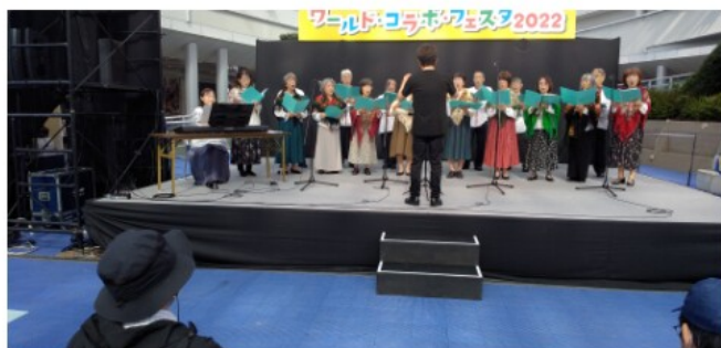
合唱団「ミール」による合唱の様子

世界が混乱する中「国際 交流・国際協力・多文化共 生などをテーマとした東海 地方81団体がステージ・ブ ースに特色を生かし華やか に展開しました。